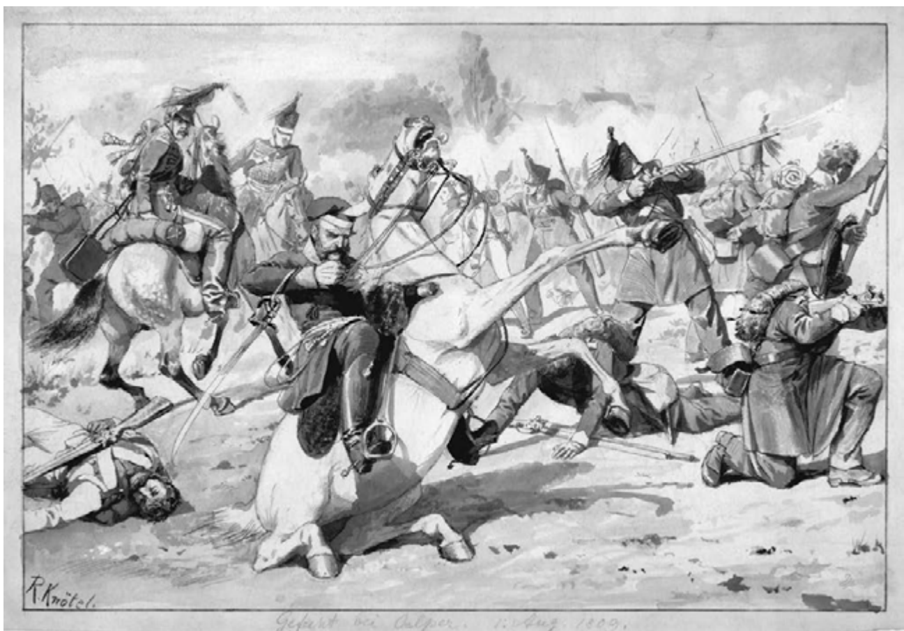
Das Gefecht bei Oelper am 1. August 1809 fand zwischen Truppen des napoleonischen Königreichs Westphalen und der Schwarzen Schar unter Herzog Friedrich Wilhelm von Braunschweig-Oels bei dem Dorf Ölper nahe Braunschweig statt. Zeichnung (weiß gehöht) von Richard Knötel um 1900.